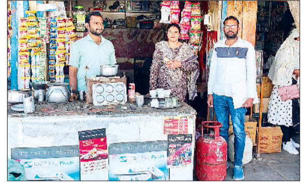
नारनौल। निरीक्षण के दौरान दुकान से घरेलू सिलेंडर बरामद करती टीम।