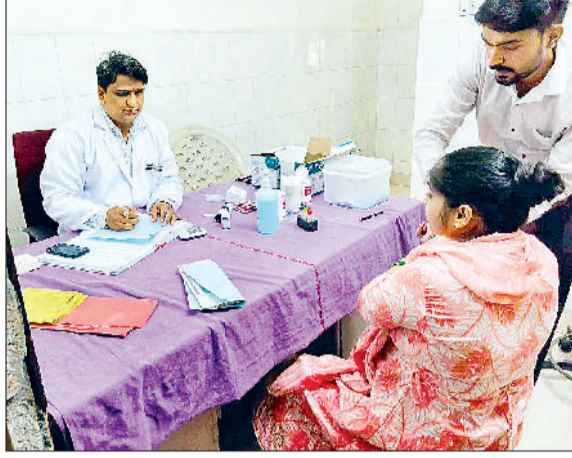
मंडी अटेली। कैंप में गर्भवती महिलाओं की जांच करते हुए।

सामुदायिक स्वास्थ्य केंद्र अटेली में वीरवार को प्रधानमंत्री मातृत्व अभियान के तहत दो दिवसीय विशेष स्वास्थ्य जांच कैंप का आयोजन किया गया। इस कैंप में पहले दिन कुल 68 गर्भवती महिलाओं ने अपनी स्वास्थ्य जांच करवाई, जबकि 23 महिलाओं के अल्ट्रासाउंड किए गए। गर्भवती महिलाओं को एक ही छत के नीचे जांच, परामर्श और आवश्यक दवाइयां उपलब्ध कराई गईं, जिससे उन्हें काफी राहत मिली। स्वास्थ्य विभाग की ओर से यह मातृत्व कैंप हर महीने चार बार नौ, 10, 23 और महीने की अंतिम तारीख को आयोजित किया जाता है। इन कैंपों में गर्भवती महिलाओं को लेडी डॉक्टर द्वारा विस्तृत जांच की जाती है और उनके स्वास्थ्य में