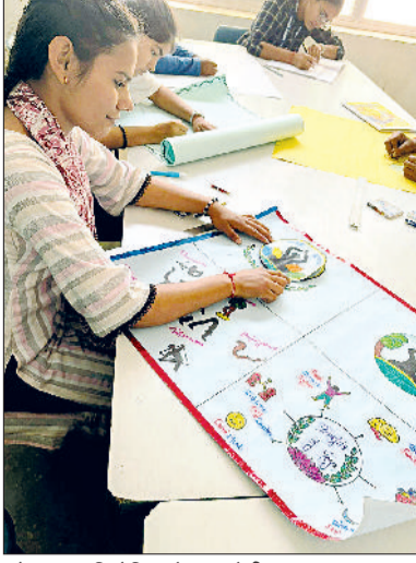
महेन्द्रगढ़। प्रतियोगिता में भाग लेती छात्राएं।