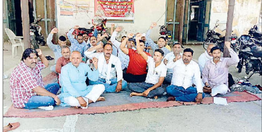
नारनौल। नप परिसर में धरना देते फायर कर्मी एवं यूनियनों के पदाधिकारी।

फायर ब्रिगेड कर्मचारी दो दिनों से अपनी मांगों को लेकर हड़ताल पर हैं। कर्मचारी फरीदाबाद अग्निकांड में शहीद हुए साथियों के परिवारों को न्याय दिलाने की मांग कर रहे हैं। नगर पालिका कर्मचारी संघ की शाखा अग्निशमन विभाग कर्मचारी यूनियन हरियाणा के आह्वान पर फरीदाबाद अग्निकांड में शहीद हुए फायर कर्मियों को शहीद का दर्जा देने की मांग को दूसरे दिन भी हड़ताल की। हड़तालियों ने फायर ब्रिगेड कार्यालय के बाहर धरना दिया और नगर परिषद परिसर से बाहर सड़क पर उतरकर प्रदर्शन किया। इस धरना-प्रदर्शन को नया कर्मचारियों समेत सर्व कर्मचारी संघ ने भी अपना खुला समर्थन दिया।