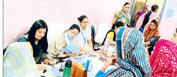
महेन्द्रगढ़। कैंप में गर्भवती महिलाओं की जांच करते चिकित्सक।