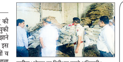
कनीना। गोदाम का निरीक्षण करते अधिकारी।

हाल ही में हुई बारिश से खेतों में खड़ी गेहूं की फसल पसर गई, जबकि कटाई की जा चुकी सरसों की फसल काली पड़ गई। जिसे सुलझाने के लिए किसान जुट गए हैं। विकास खंड में इस बार करीब 18 हजार हेक्टेयर भूमि पर सरसों व करीब नौ हजार हेक्टेयर भूमि पर गेहूं के अलावा पांच हजार हेक्टेयर भूमि में जौ, चना, आलू, मटर, गाजर, मूली, हरी मिर्च व हरा चारा की फसल की पैदावार की गई। सरसों व गेहूं की फसल की मार पड़ने से किसानों के अरमान आंशु बनकर बह रहे हैं। मौसम विभाग की ओर से बारिश व ओलावृष्टि की संभावना