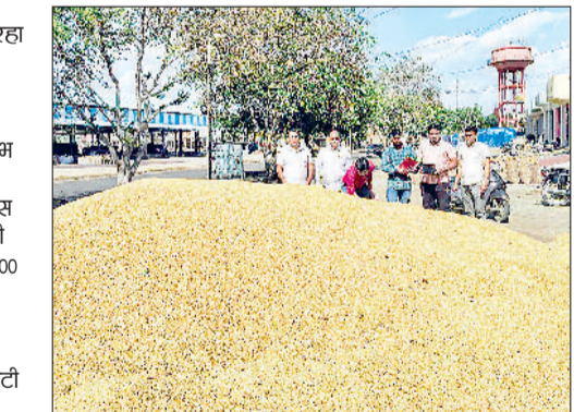
मंडी अटेली। अनाज मंडी में गेहूं की ढेरी।

मंडी अटेली। नई अनाज मंडी अटेली में सरसों के साथ अब गेहूं की आवक बढ़ने पर जोर दिया जा रहा है, ताकि किसानों को अधिक विकल्प और बेहतर दाम मिल सकें। पिछले 11 दिनों में मंडी में 62,650 क्विंटल सरसों की आवक दर्ज की गई, जिसे 2894 किसानों ने प्राइवेट व्यापारियों को बेचकर अच्छा लाभ उठाया। इससे यह साफ है कि मंडी में किसानों को प्रतिस्पर्धी मूल्य मिल रहे हैं। इसी बीच पहली बार इस सीजन में गेहूं की आवक भी मंडी में देखने को मिली जहां परचेज एजेंसी द्वारा पांच किसानों कि करीब 200 क्विंटल गेहूं की खरीद की गई। निरीक्षण के दौरान गेहूं की गुणवत्ता और नमी मानकों के अनुरूप पाई गई जिससे यह संकेत मिलता है कि गेहूं उत्पादक किसान भी मंडी का रुख कर सकते हैं। मार्केट कमेटी द्वारा स्टॉक और मंडारण पर नजर रखने के लिए विशेष टीम गठित की गई है, ताकि पारदर्शिता बनी रहे और किसानों को उचित मूल्य मिल सके।