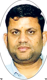
लाभ नहीं मिलेगा।