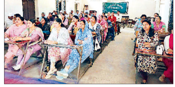
कनीना। जनगणना का प्रशिक्षण लेते प्राणक।

नारनौल। पुलिस अधीक्षक के दिशानिर्देशों अनुसार जिले में अपराधों पर अंकुश लगाने और अपराधियों को धरपकड़ के लिए चलाए जा रहे अभियान के तहत पुलिस ने बड़ी कार्रवाई की है। प्रवक्ता के लिए कि आठ अप्रैल को जिले की पुलिस टीमों ने मुस्तेदी दिखाते हुए अलग अलग अपराधिक मामलों में सफाई कूल 16 आरोपितों को गिरफ्तार करने में सफलता हासिल की है। विभिन्न थानों की पुलिस टीमों ने कार्रवाई करते हुए इन आरोपितों को काबू किया है।