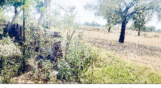
मंडी अटेली। गोकलपुर विद्यालय में अधूरी एवं टूटी हुई चारदीवारी।

मंडी अटेली। अटेली क्षेत्र के गांव गोकलपुर स्थित राजकीय उच्च विद्यालय में अधूरी चारदीवारी के चलते स्कूल परिसर में अस्वामाजिक गतिविधियों का मामला सामने आया है। इस बारे में विद्यालय प्रशासन की ओर से खंड शिक्षा अधिकारी अटेली को लिखित शिकायत देकर जल्द समाधान की मांग की गई है। शिकायत पत्र के अनुसार स्कूल की चारदीवारी लंबे समय से अधूरी पड़ी है, जिससे बाहरी लोगों का स्कूल में आना-जाना बना रहता है। विद्यालय प्रबंधन ने बताया कि चारदीवारी निर्माण के लिए पहले भी विभाग को अवगत कराया जा चुका है और बजट की मांग की गई थी, लेकिन अब तक कोई ठोस कार्रवाई नहीं हुई है। इस कारण अभिभावकों और स्टफ में भी चिंता का माहौल है। स्कूल प्रशासन ने मांग की है कि चारदीवारी का निर्माण कार्य शीघ्र पूरा कराया जाए और परिसर में हो रही अवैध गतिविधियों पर रोक लगाने के लिए कड़ी कार्रवाई की जाए।