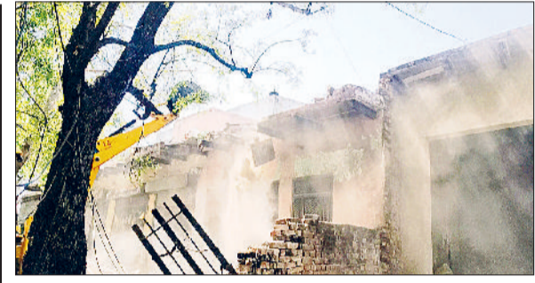
मंडी अटेली। कारिया में जेसीबी की सहायता से अतिक्रमण हटाते हुए।

हरिभूमि न्यूज ▶▶ कनीना हाल ही में हुई बारिश से खेतों में खड़ी गेहूं की फसल पसर गई, जबकि कटाई की जा चुकी सरसों की फसल काली पड़ गई। जिसे सुलझाने के लिए किसान जुट गए हैं। विकास खंड में इस बार करीब 18 हजार हेक्टेयर भूमि पर सरसों व करीब नौ हजार हेक्टेयर भूमि पर गेहूं के अलावा पांच हजार हेक्टेयर भूमि में जौ, चना, आलू, मटर, गाजर, मूली, हरी मिर्च व हरा चारा की फसल की पैदावार की गई। सरसों व गेहूं की फसल की मार पड़ने से किसानों के अरमान आंशु बनकर बह रहे हैं। मौसम विभाग की ओर से बारिश व ओलावृष्टि की संभावना